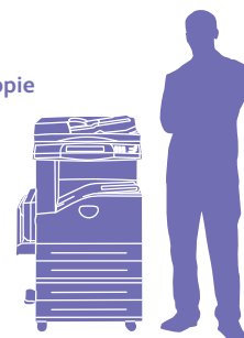
WorkCentre 5230 avec module Deux magasins